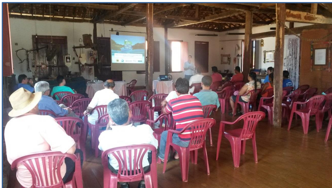
Figura 4 - Mobilizadora social da Neogeo apresentando os resultados