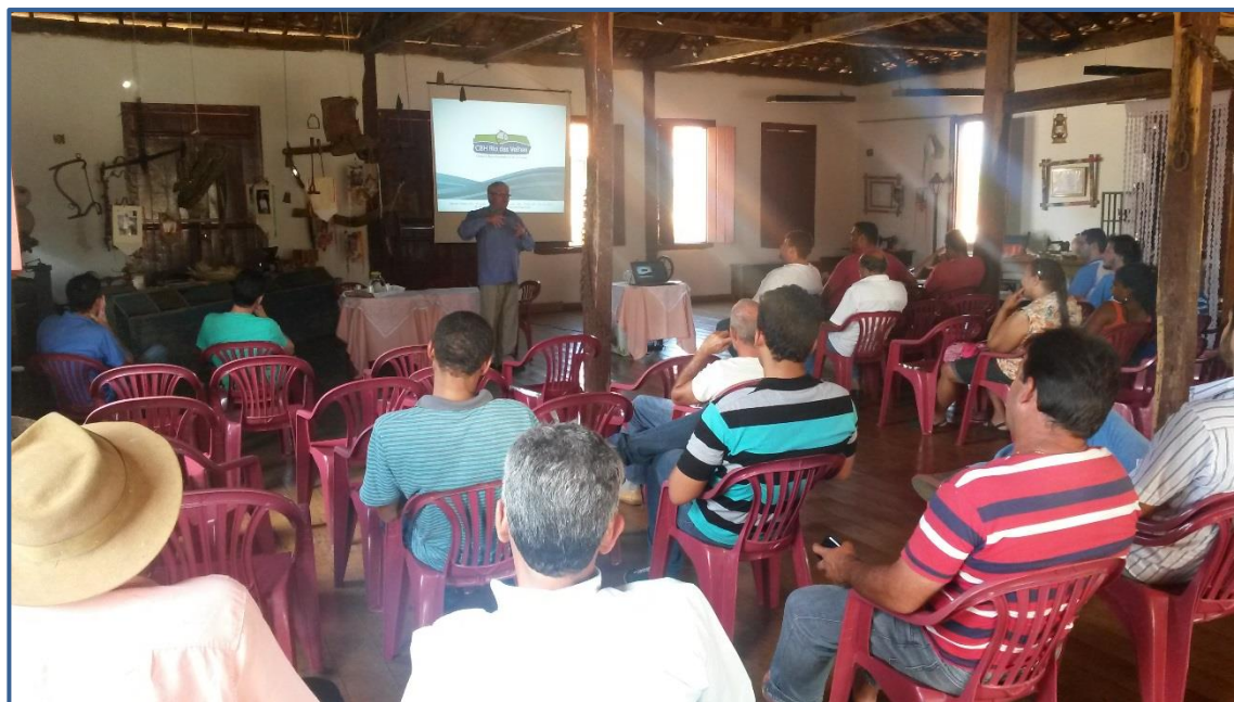
Figura 3 - Fala do Prefeito de Morro da Garça