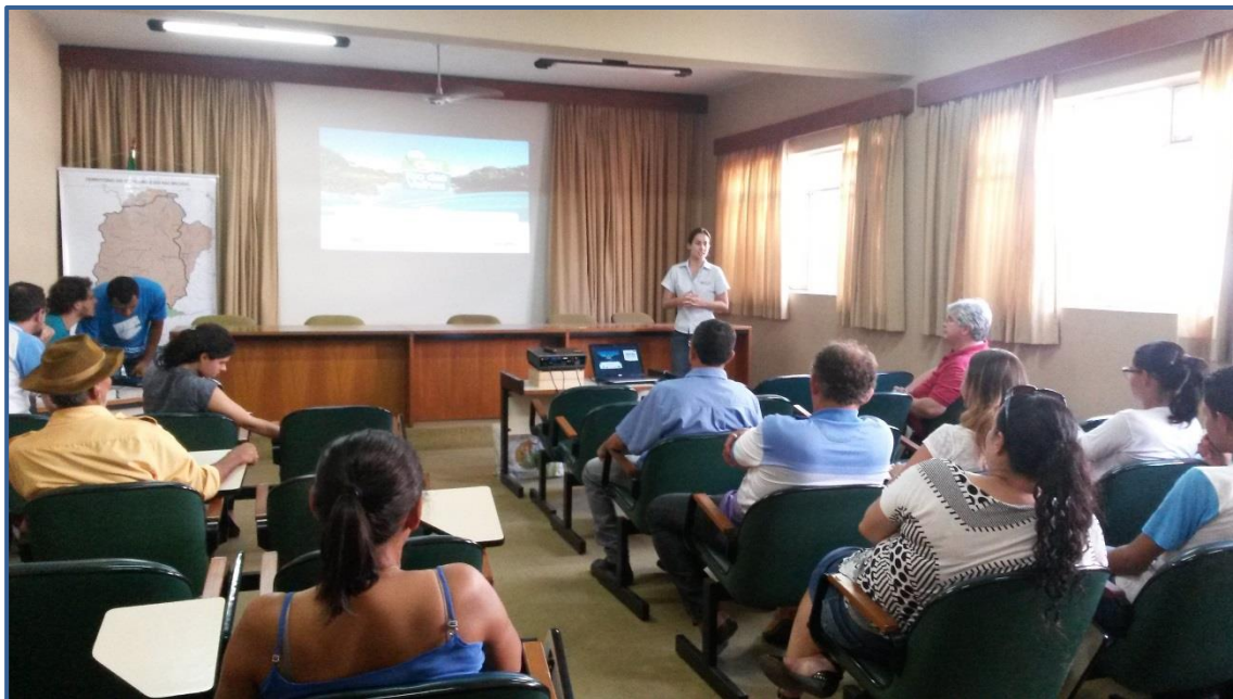
Figura 8 - Apresentação do projeto aos presentes