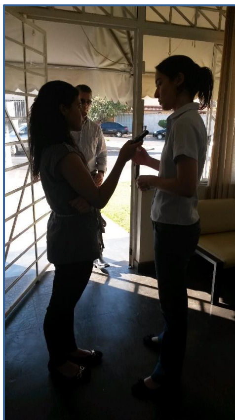
Figura 9 - Entrevista para o CBH Rio das Velhas