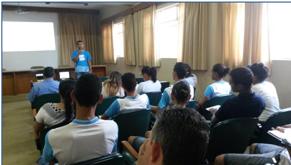
Figura 6 - Coordenador do SCBH Rio Bicudo abrindo a reunião