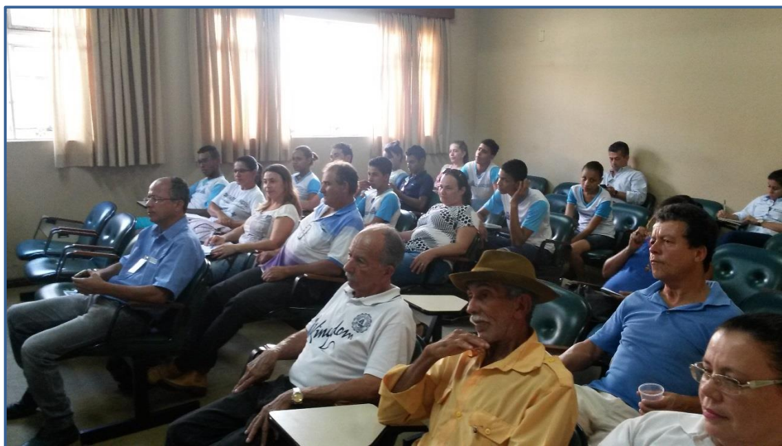
Figura 7 - Participantes da reunião