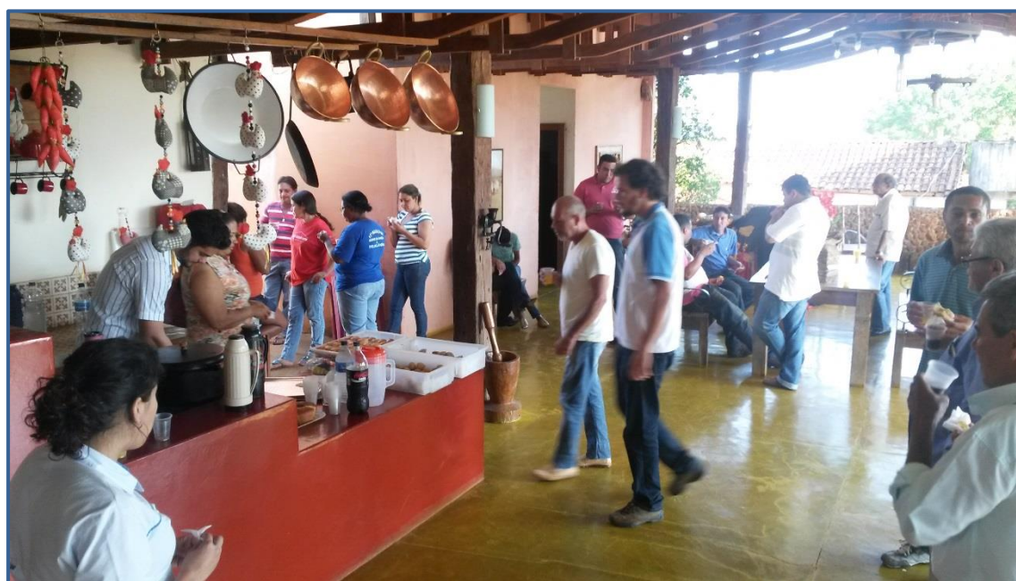
Figura 5 - Lanche servido aos presentes